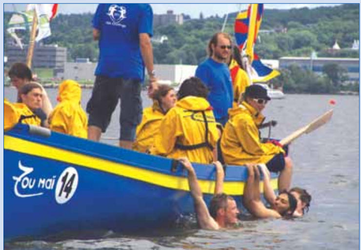
Moment de détente sur la yole provençale Zoumaï.