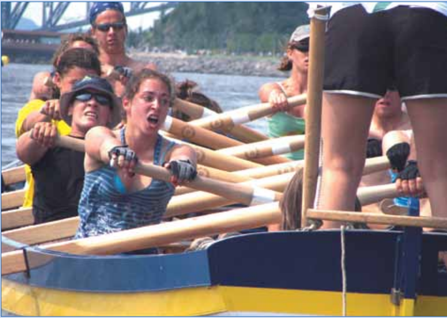
L'équipage de Sault-au-Matelot en action