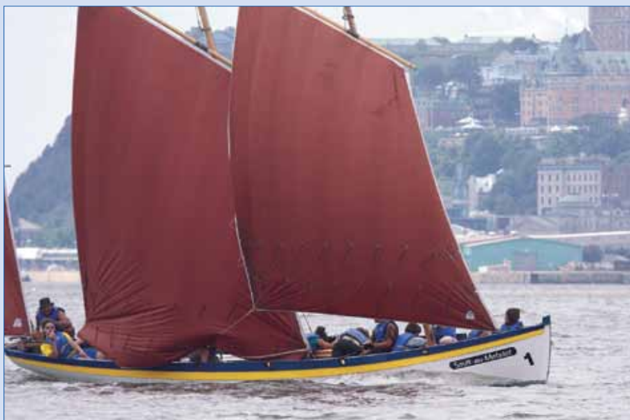
La yole québécoise Sault-au-Matelot a remporté l'épreuve de fort belle façon.

On m'a demandé d'attraper les amarres des yoles, ce qui me place aux côtés du juge breton Paul Lejuncour. Et que pense-t-il de l'évènement... et des performances de nos jeunes marins québécois? «Vous savez, les