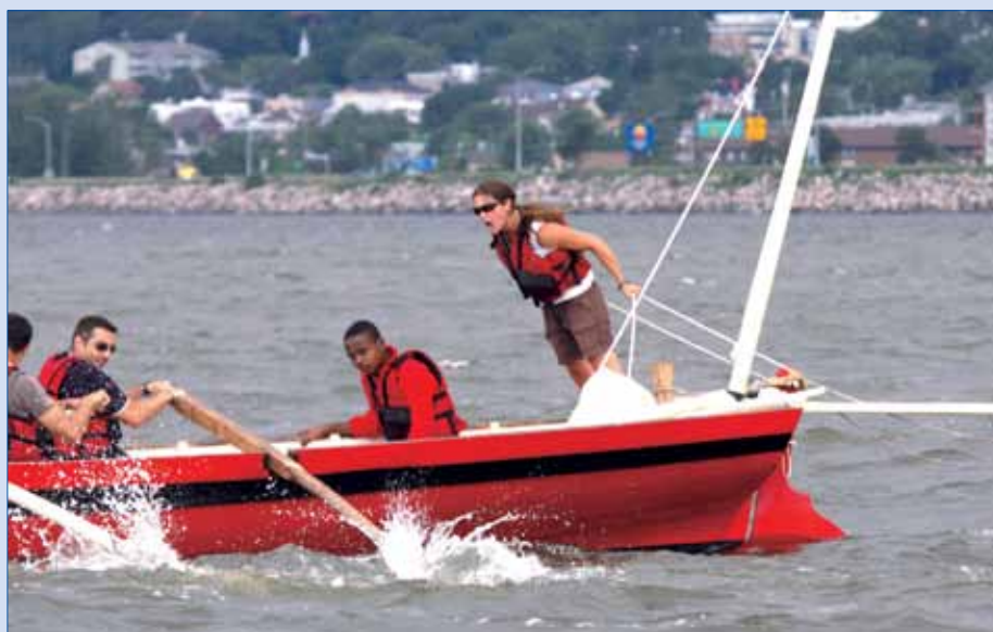
Les épreuves d'aviron exigent beaucoup de coordination et une bonne dose d'énergie.