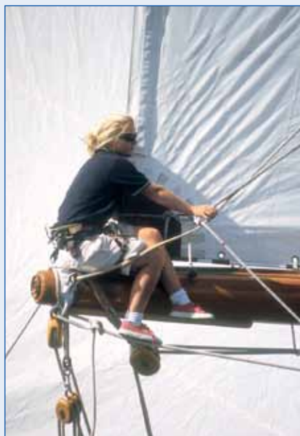
Une équipière perchée sur l'une des bômes de la goélette Altair .

Ils arrivent de Cannes chaque année au début du mois d'octobre. Ils déploient leurs immenses voiles blanches pour franchir les 23 milles qui les séparent du golfe de Saint-Tropez dont ils prennent possession pour un peu plus d'une semaine. Ils sont une soixantaine environ à se réunir dans le célèbre petit village provençal pour donner l'un des plus beaux spectacles maritimes que l'on puisse admirer de par le monde. Des yachts de plaisance élevés au rang d'œuvres d'art pour bon nombre d'entre eux et entretenus avec un soin méticuleux par des propriétaires aussi attentifs à leur beauté que d'authentiques collectionneurs. Eric Tabarly disait de la Nioulargue, rebaptisée aujourd'hui Voiles de Saint-Tropez, «qu'il avait l'impression en déambulant sur les quais de Saint-Tropez de marcher dans un livre ouvert.» On ne saurait mieux résumer un événement qui célèbre l'histoire du yachting de fort belle manière.