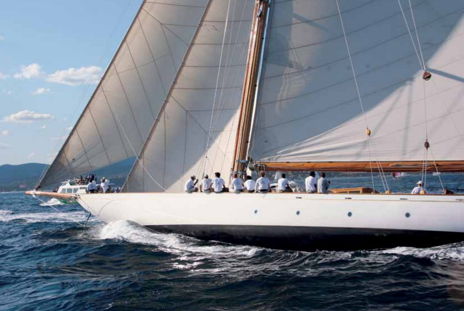
Le 23 M JI Cambria allonge la foulée. Il fut dessiné en 1927 par William Fife et lancé l'année suivante pour participer à la Coupe de l'America. La coque en bois de 34, 50 m est supportée par des membrures en acier. Cambria a connu une restauration complète en Australie.

Ils arrivent de Cannes chaque année au début du mois d'octobre. Ils déploient leurs immenses voiles blanches pour franchir les 23 milles qui les séparent du golfe de Saint-Tropez dont ils prennent possession pour un peu plus d'une semaine. Ils sont une soixantaine environ à se réunir dans le célèbre petit village provençal pour donner l'un des plus beaux spectacles maritimes que l'on puisse admirer de par le monde. Des yachts de plaisance élevés au rang d'œuvres d'art pour bon nombre d'entre eux et entretenus avec un soin méticuleux par des propriétaires aussi attentifs à leur beauté que d'authentiques collectionneurs. Eric Tabarly disait de la Nioulargue, rebaptisée aujourd'hui Voiles de Saint-Tropez, «qu'il avait l'impression en déambulant sur les quais de Saint-Tropez de marcher dans un livre ouvert.» On ne saurait mieux résumer un événement qui célèbre l'histoire du yachting de fort belle manière.