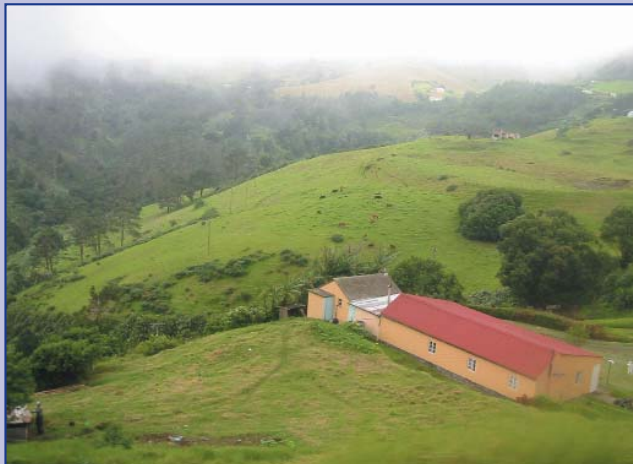
Les côtes de Sainte-Hélène sont désertiques, mais l'intérieur de l'île est particulièrement verdoyant.