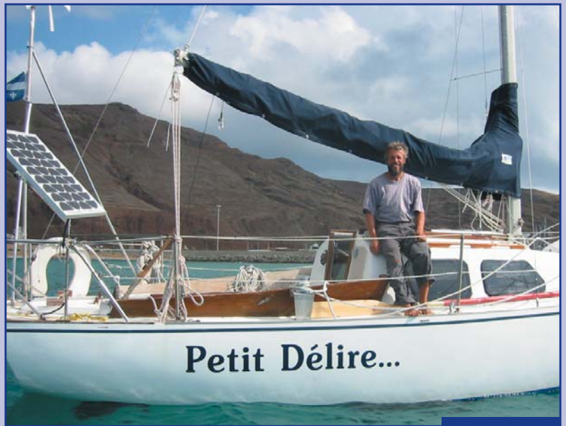
Au mouillage à Porto Santo dans l'archipel de Madère.

L'été 2001 aurait été ma 20 e année de «business voile» et ça me semblait un peu trop. J'avais réussi à vivre de la voile au pays de la glace pendant près de 20 ans et je commençais à tourner en rond. J'ai commencé par enseigner le dériveur en 1982 à Saint-Donat, continué en 1983 en organisant des expéditions de voile-camping, puis fondé en 1984 le club Voile Aventure. Mon premier baptême de mer (6 jours au large) remonte à 1985 et je visite par la suite le fleuve et le golfe du Saint-Laurent, la côte Est des États-Unis, les Bahamas, Madère, les Canaries, les Antilles. En 1995, je laisse le club Voile Aventure. Après quelques années, les défis me manquent. Je suis mûr pour me lancer dans une autre entreprise, celle de naviguer tout simplement par pur plaisir.