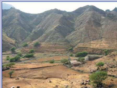
La beauté aride des îles du Cap-Vert, ici sur l'île de Sao Nicolau.

Après plusieurs acrobaties, tout est réparé et Petit Délire... pointe à nouveau son étrave vers le large.