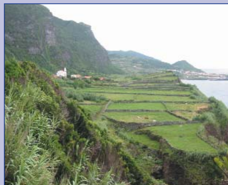
L'île de Flores, petite perle des Açores

Le moteur hors-bord est de retour chez Loutec. Petit Délire... et son skipper, qui a un gros motton au fond de l'estomac, quittent le club nautique de Havre-Aubert, Îles-de-la-Madeleine, en direction des Açores. Le serrement au fond de l'estomac ne vient pas du mal de mer, qui, heureusement, ne s'est jamais manifesté lors de cette expédition. Ce ser-