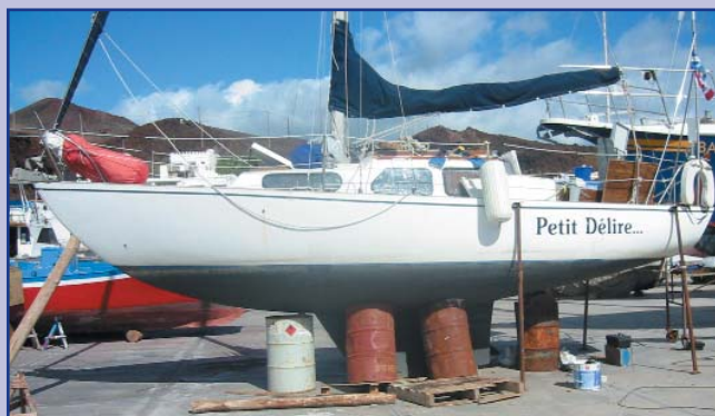
En cale sèche.