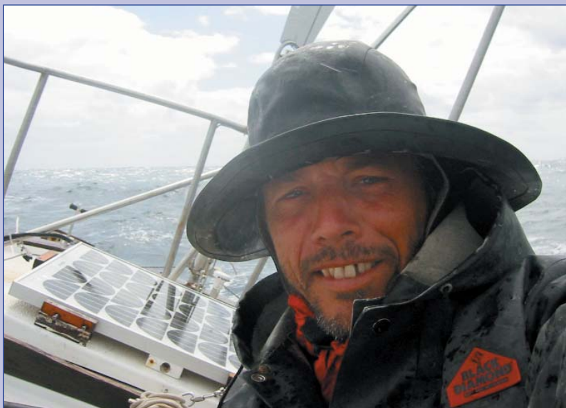
L'auteur dans l'Atlantique Sud avant qu'il touche Le Cap

Je viens de franchir le 30° sud et je n'ai pas besoin des pilot chart pour savoir que je viens de franchir la Zone Sub Tropicale de Convergence (Z.S.T.C.). L'eau dans laquelle je navigue vient désormais de l'Antarctique.