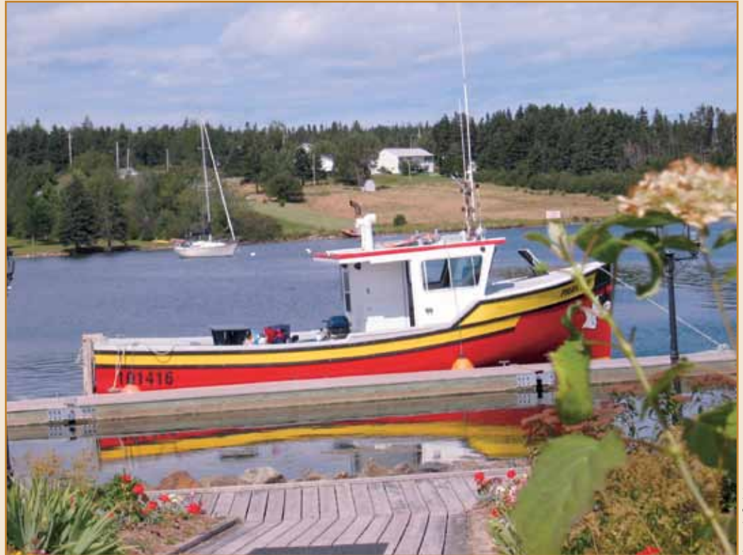
La petite marina de St. Peters juste au NO du canal.

À avoir tant musardé, on sera content de retrouver la civilisation à Baddeck. Amateurs de régates, vous serez comblés. Le quai